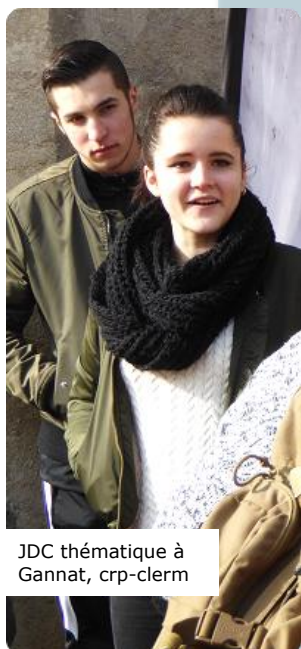
JDC thématique à Gannat, crp-clerm

Dans une interview du 10 mai 2017 donnée à La Dépêche, le général précisait l'esprit du lien entre les armées et la jeunesse. Extrait :