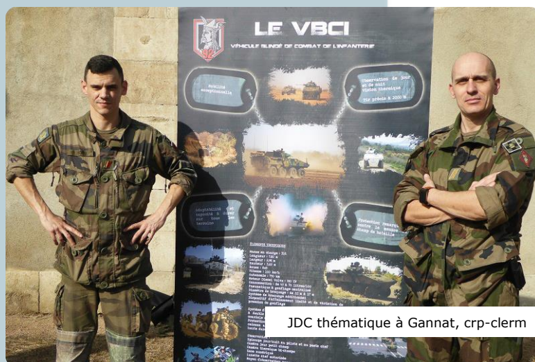
JDC thématique à Gannat, crp-clerm

C'est à chaque fois des échanges riches entre ces deux fantassins et des jeunes qui ne connaissent le métier militaire que par ce qu'ils en voient à la télévision ou par « oui-dire ». Objectif de la CAR : faire comprendre l'importance de la mission de nos armées pour la défense de tous.