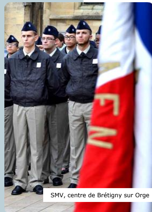
SMV, centre de Brétigny sur Orge

C'est plus difficile pour ceux qui n'ont rien fait depuis trois ou quatre ans, mais tous saisissent rapidement en quoi cette formation leur est utile : rédiger un CV, lire les petites annonces, payer une facture, contracter un emprunt bancaire... Notre mission est de les aider dans cette voie, afin qu'ils deviennent autonomes. »