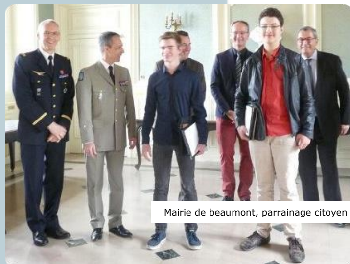
Mairie de Beaumont, parrainage citoyen

Appuyé par de nombreux acteurs institutionnels (ministère de l'Education nationale) et associatifs (associations de maires, CIDJ, APHG,...), il dure tout au long du parcours de citoyenneté et prend fin officiellement au lendemain de la journée défense citoyenneté. Il s'impose naturellement en cette période de recherche de cohésion nationale face à l'insécurité actuelle.